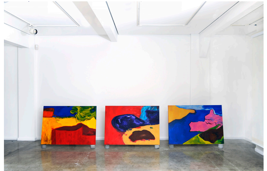
Beiras espantosas, 2023 óleo sobre tela, madeira, balde de plástico, brita e apoios de cimento 90 x 390 x 50 cm