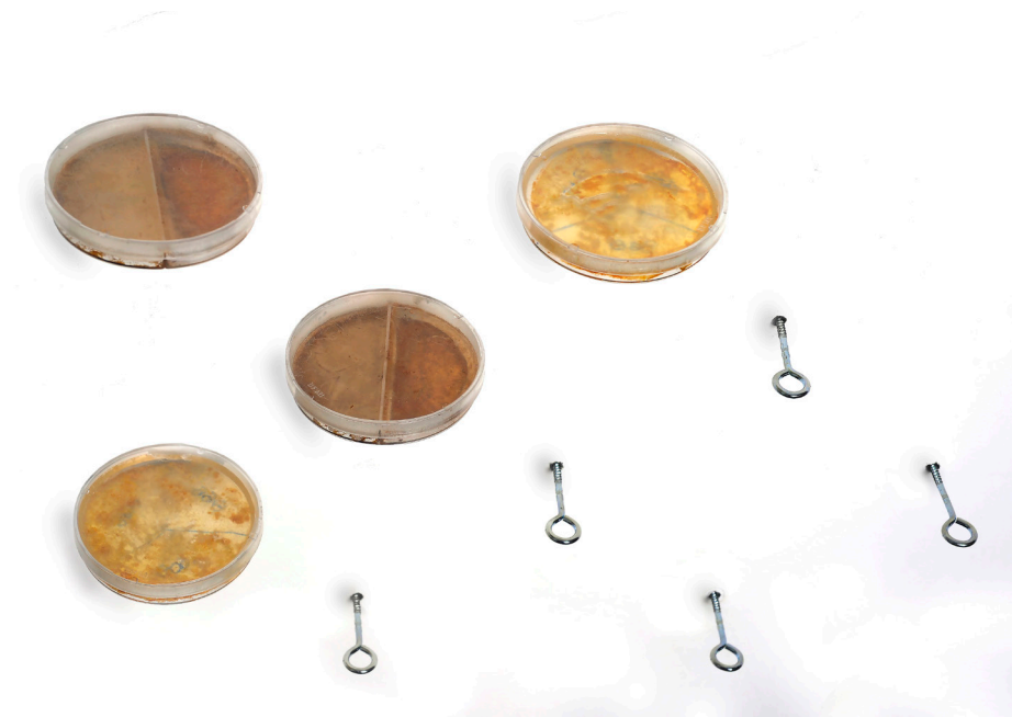
Projeto Microbioma, 2023 (detalhe) ação de coleta, placas de Petri e material biológico humano 140 x 260 x 310 cm