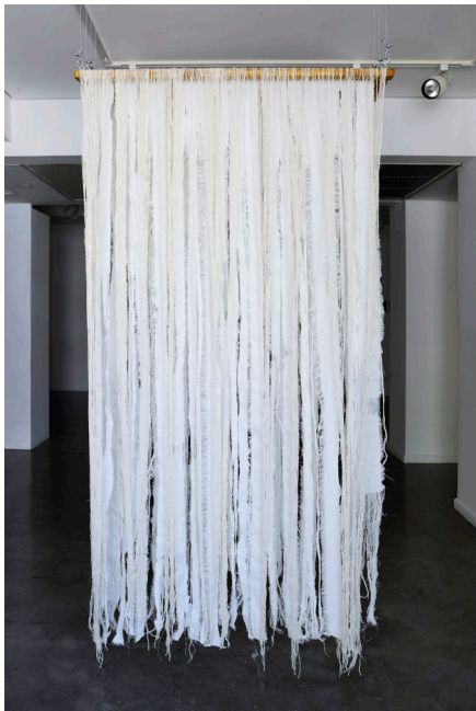
Shaatnez, 2023 lã, linho, madeira e aço 200 x 150 x 24 cm