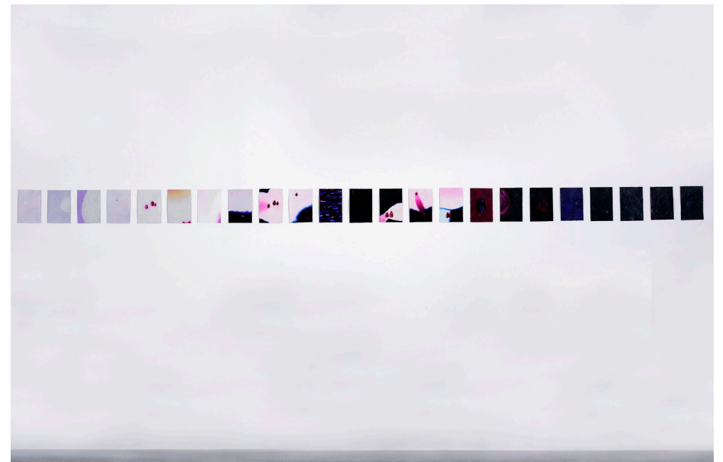
Série Além Daqui , 2023 óleo sobre tela 19 x 387 cm