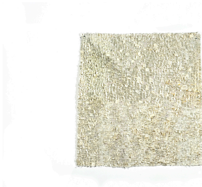
estética , 2023 tecido (cetim) colado sobre tecido 80 x 84 cm